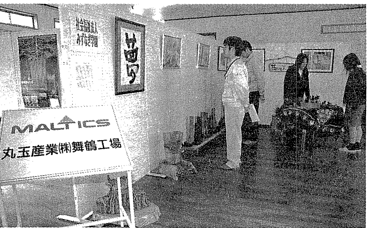
利用者たちの作品を見る同工場の社員たち

同学園利用者が木質建材を製造する同工場に就職した縁があり、二〇〇三年からは利用者の就労支援の一つとして、同工場で作業実習の受け入れを始めた。また、鹿原の学園の作業棟を作品を展示するアトリエ兼ギャラリーに改修する際、同工場や塗装会社などが床板や壁紙などの提供から張り替えの作業まで、無償で協力する応援をし、〇五年に「夢工房」が完成